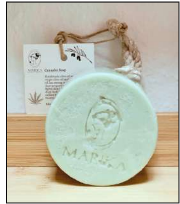
SEIFE & KOSMETIK